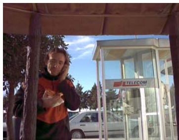
Non te la da... Non te la da...