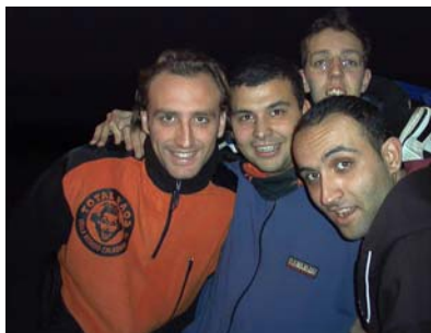
I quattro dell'Ave Maria