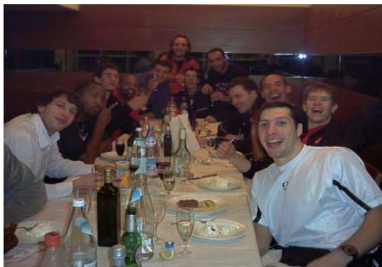
Alla festa del Cita. Minchia quantu mangiammu!!!