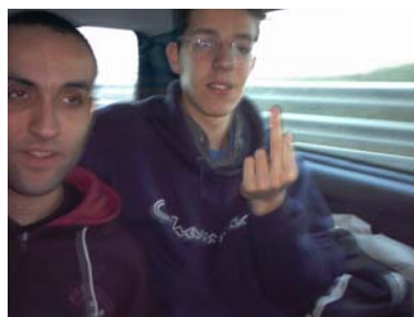
Come si vede bene che hanno dormito sempre...