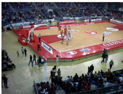
Non ci vediamo più... non ci cediamo più; ci salutiamo adesso